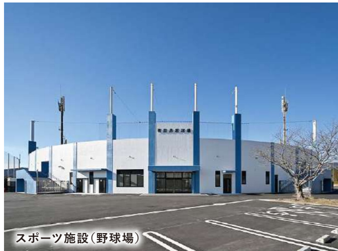
スポーツ施設（野球場）