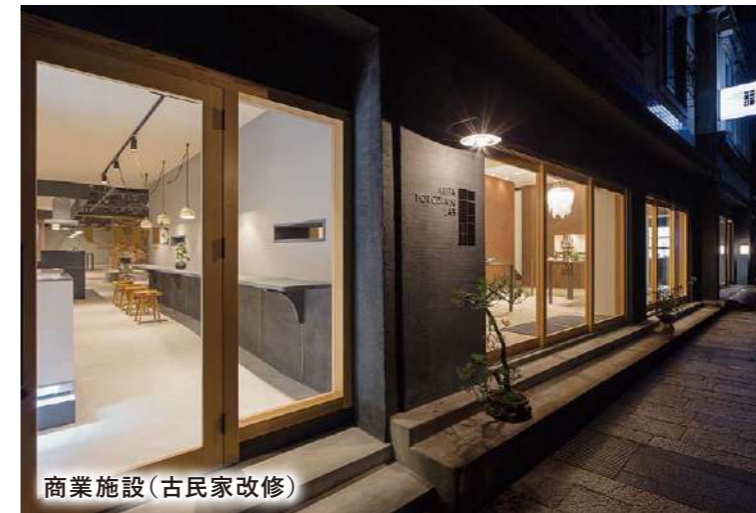
商業施設（古民家改修）